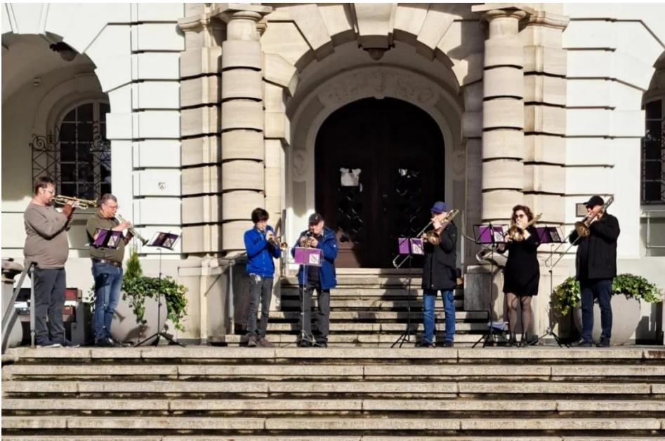
Bläser vor dem Herforder Rathaus

Am Samstag, 10. Februar musizierten einzelne Laarer Bläser in Herford bei bestem sonnigem Wetter auf der Rathaustruppe für die Besucher des Wochenmarktes.