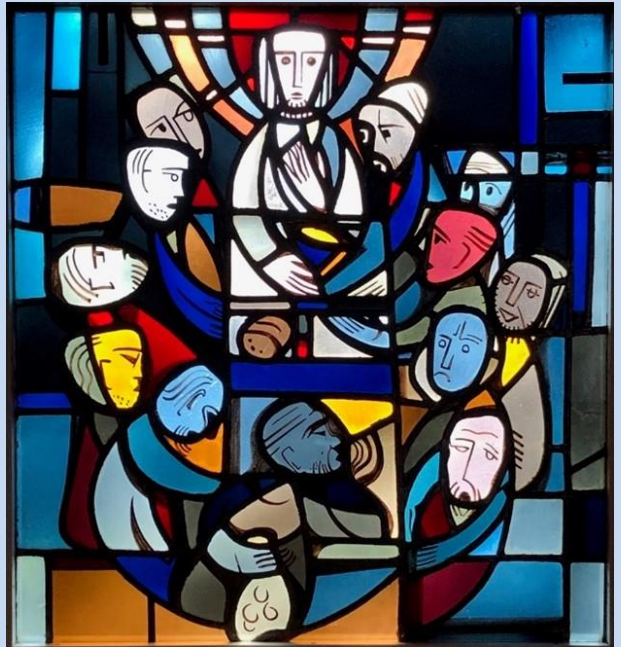
Friedrich Paul Scholz: Abendmahl Sakristeifenster in Laar