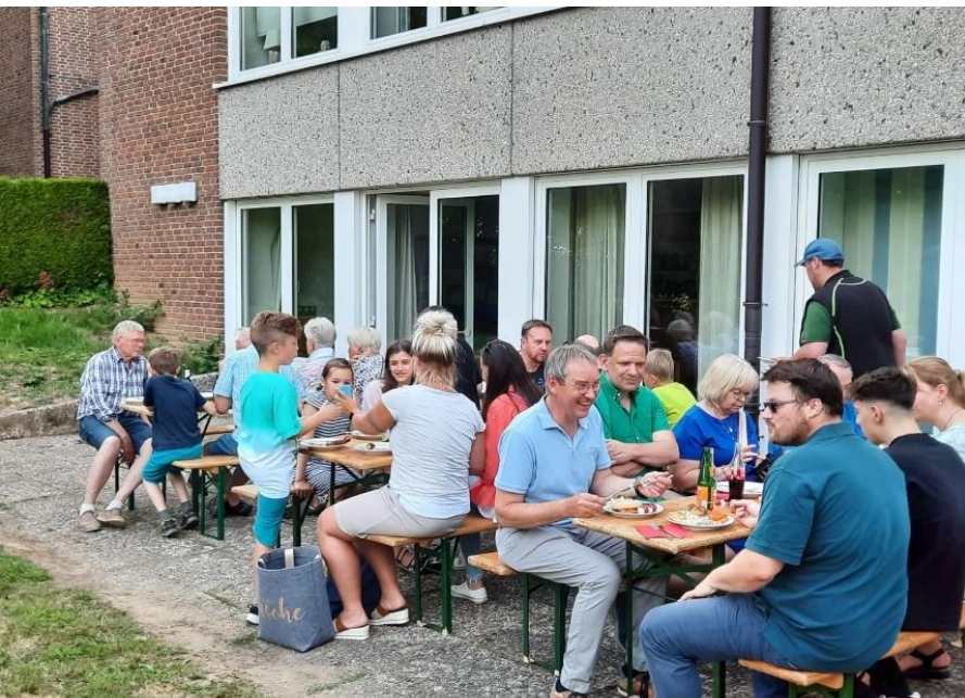
Gemütliches Beisammensein am Gemeindehaus