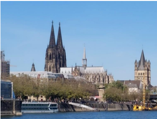
Blick auf Köln

Am 23. September starteten wir zu einem Vereinsausflug nach Bonn . Kaum in Bonn angekommen, stieg ein Stadtführer zu. Nach der Stadtrundfahrt mit Erläuterungen besuchten wir das Haus der Geschichte. Die jüngere deutsche Zeitepoche wurde thematisiert und durch zahlreiche Originalexponate eindrucksvoll dargestellt. Der Abend endete mit einem