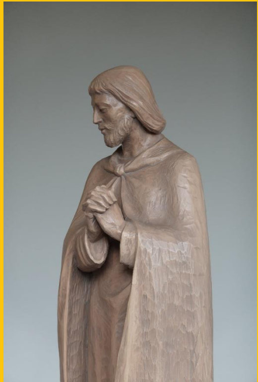
Joseph – Laarer Krippenfigur