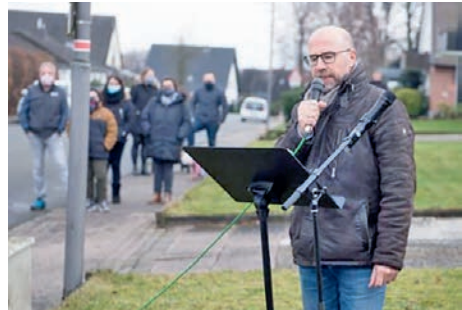
Erste Station an der Stedefreunder Straße in Eickum.