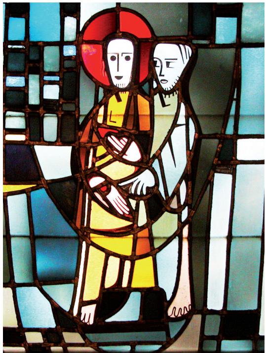
Jesus und Thomas der Zweifler