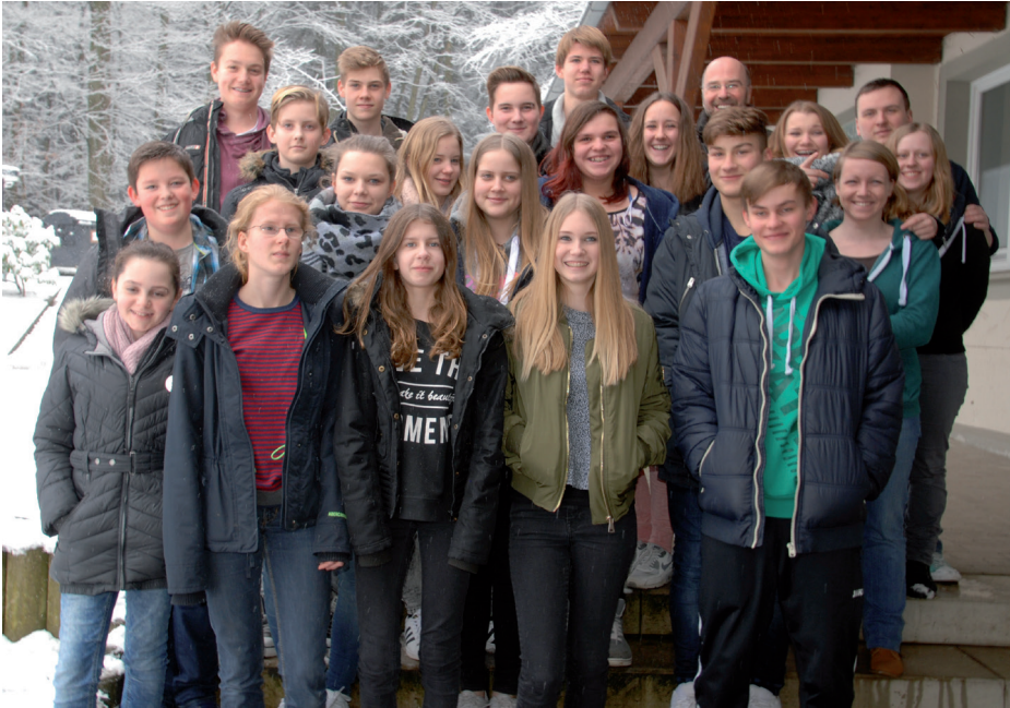
Unsere Konfirmanden vor der Berghütte Rödinghausen.