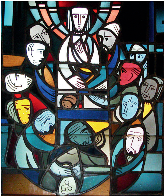
Abendmahl Sakristeifenster in Laar