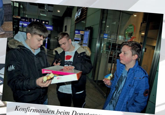
Konfirmanden beim Donutessen