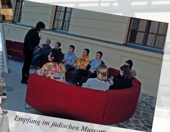
Empfang im jüdischen Museum