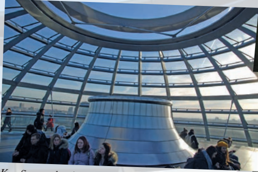
Konfirmanden in der Reichstagskuppel