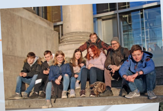
Auf der Treppe zum Reichstag