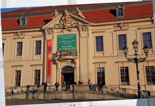
Eingang Jüdisches Museum