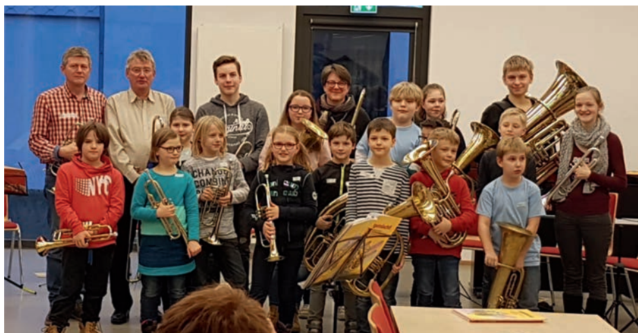
Foto vom Jungbläserntag Herford

Im letzten Vierteljahr drehte sich vieles um unsere Jungbläser. Nach vielen Unterrichtseinheiten hatten sie ihren ersten kleinen Auftritt. Am Montag, dem 10. Dezember, gab es im Rahmen des offenen Advents unseren Adventsmarkt mit leckeren Kleinigkeiten und per Diashow einen Rückblick auf die letzten Jahre, natürlich erst nachdem die Jungbläser ihr Können gezeigt hatten.